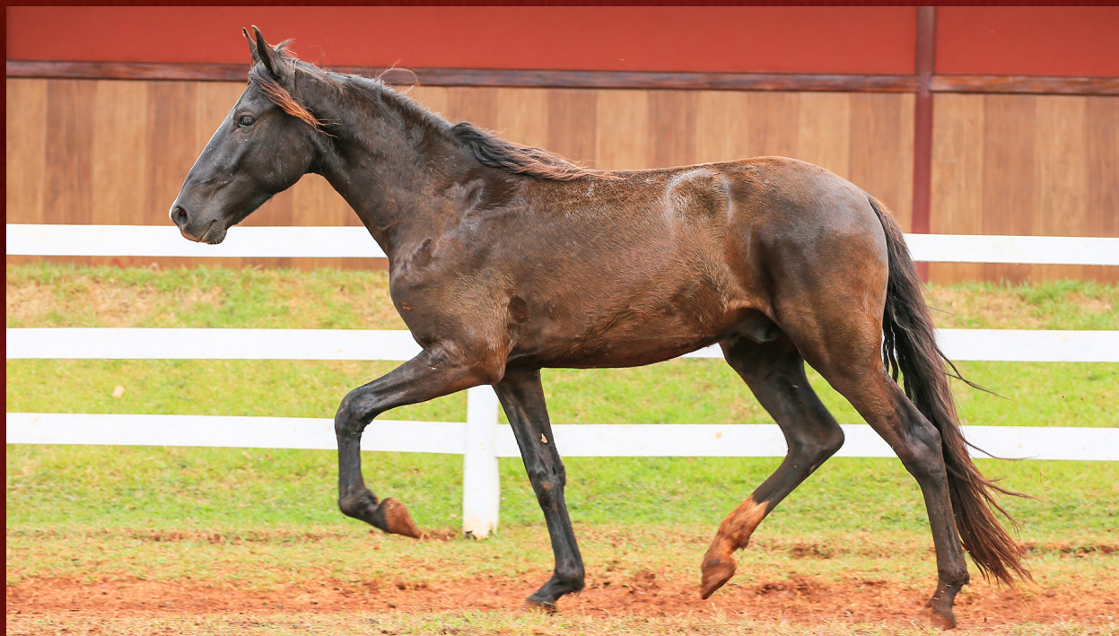
ZE CALAMBAU I

FATOR DA CAVARÚ-RETÃ CINDERELA DA FRISUL