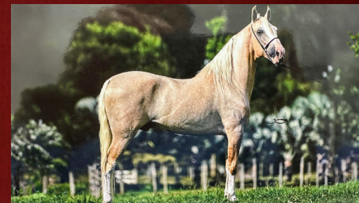
PRENHEZ POR ZANDOR EMP CALAMBAU I