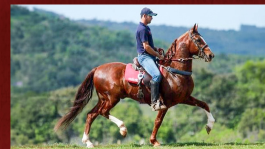
CAÇADOR DA SELVA MORENA - AVÔ