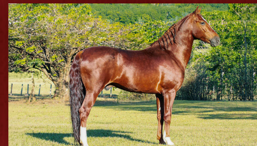
ORIXÁ DE PATROCÍNIO - PAI