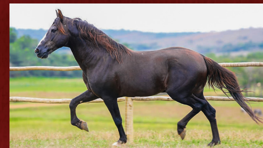
TRILHO DA ZIZICA - AVÔ