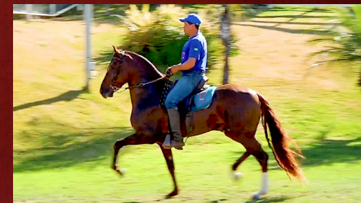
ZE CALAMBAU I - PAI