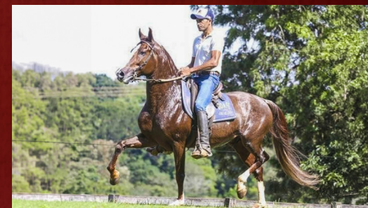
RUBICÃO DA BOA FÉ - PAI