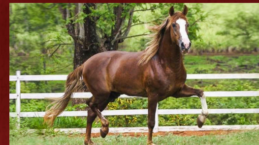
GAMÃO DO EXPOENTE - AVÔ