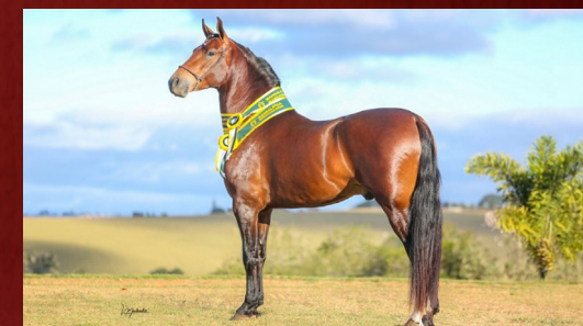
DÍNAMO DO CONFORTO - PAI