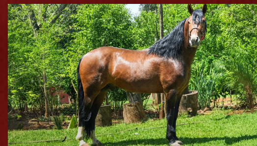
ENZO J.N.53 - PAI