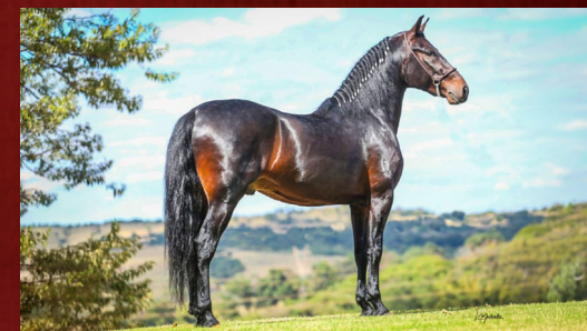
ZÉ DA BOA FÉ - PAI