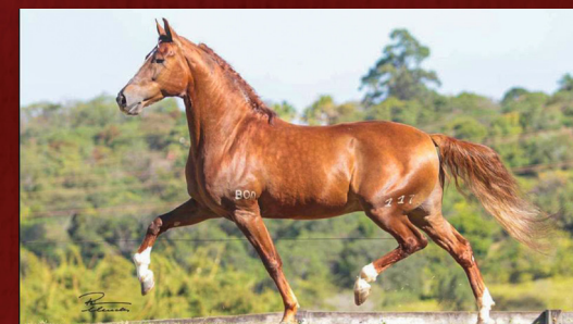
RUBICÃO DA BOA FÉ - PAI