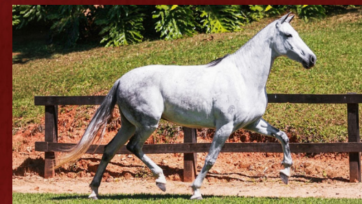
UVAIA PAREDÃO - MÃE