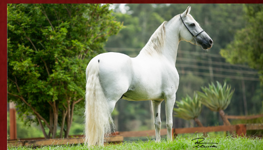
RAJY ELFAR - AVÔ