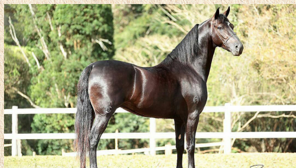
CAXAMBU ÍDOLO - AVÔ