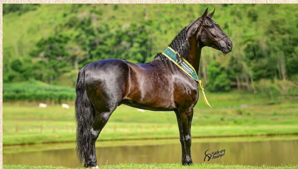
MAESTRO JFS - PAI