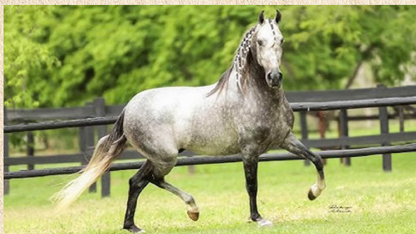
JUIZ DE ALCATÉIA - AVÔ