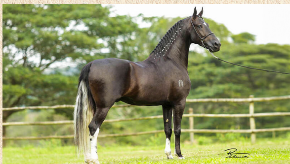
IDOLO NEGRO TOULON - PAI