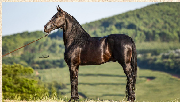
KADAFI DO HARAS CASCATINHA - PAI