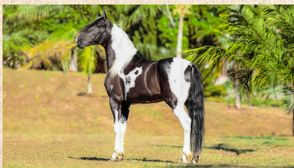
ÍNDIO DA ENSEADA - PAI