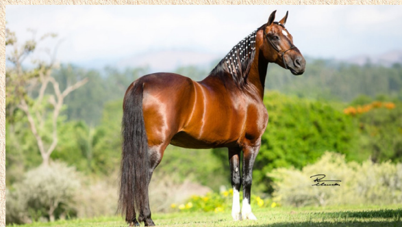
LÓTUS DA CATIMBA - BISAVÓ