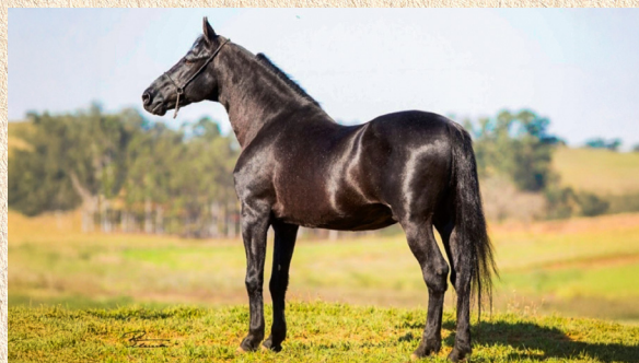
HAITY CAXAMBUENSE - AVÓ