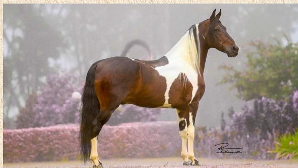
HORIZONTE RRC - PAI

GAITA DA MARINA SANSÃO AMADO IPÊ PREFERIDA DA MARINA SANSÃO