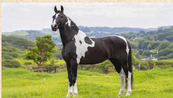
BELETTI SÃO LOURENÇO - PAI