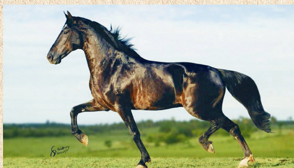
ELFO DO PORTO AZUL - PAI

PADANGUE DA LAGOA DA SERRA MADONA DA LAGOA DA SERRA