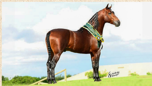
ARLEQUIM SERRA BELA - PAI