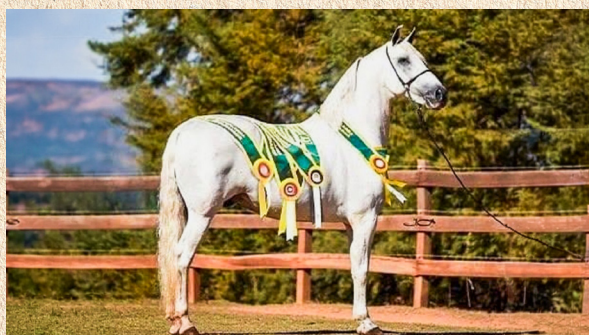
ISTAMBUL DO MONTEIRO - PAI