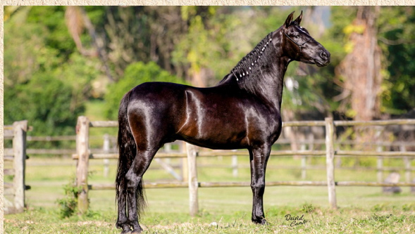
GLADIADOR DO PIXAÓ - PAI