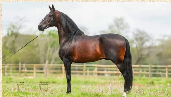
RADIANTE FORUM - AVÔ