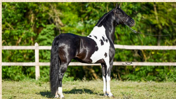
GAIATO DO BERRO D'ÁGUA - PAI