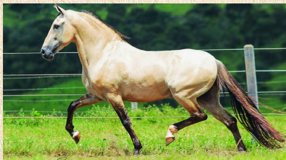
FAVACHO ESTANHO - AVÔ