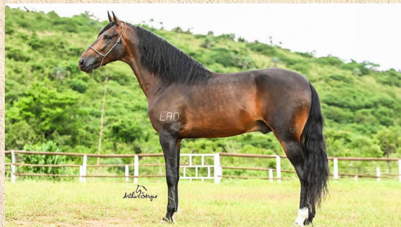
XERIFE E.A.O. - PAI

NÔMADE DA TERRA VERMELHA APOSTA DE PAGURIFÁ