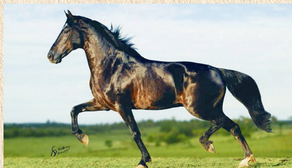
ELFO DO PORTO AZUL - AVÔ