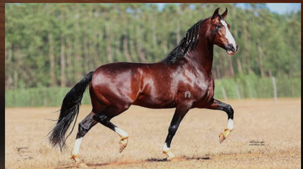
TEOREMA DA MORADA NOVA - AVÔ