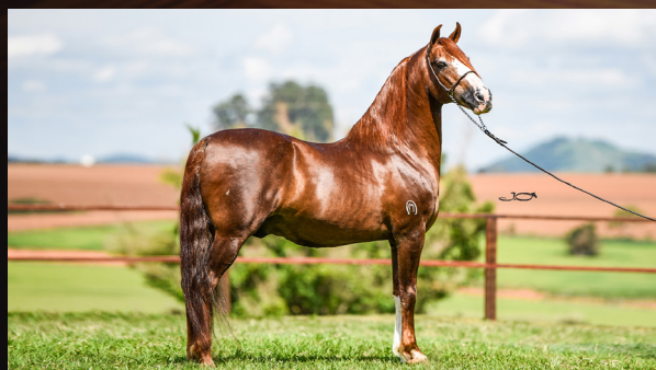
GALANTE DO EXPOENTE - PAI

ELO KAFÉ DA NOVA NEGRA DA SANTA ESMERALDA