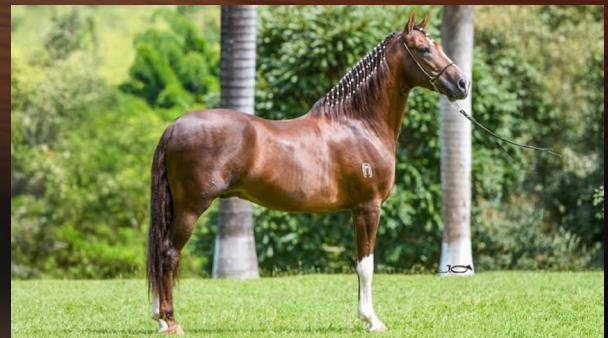
MONARCA DE ALCATÉIA - AVÔ