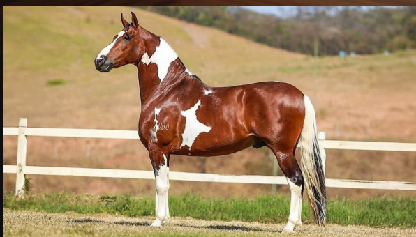
MINISTRO DE ALCATÉIA - PAI