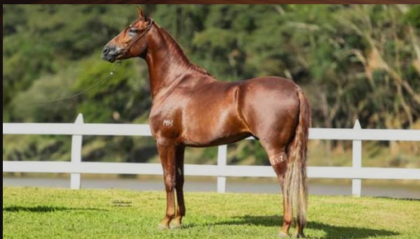
ETILO DO MH - PAI