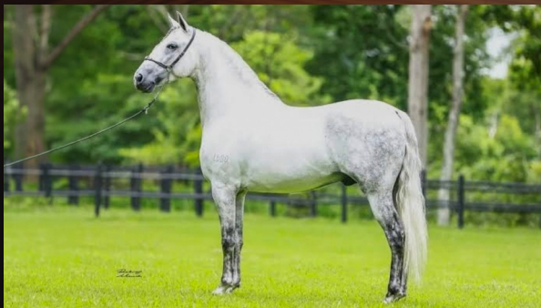
QUEBRUTO DE ALCATÉIA - PAI