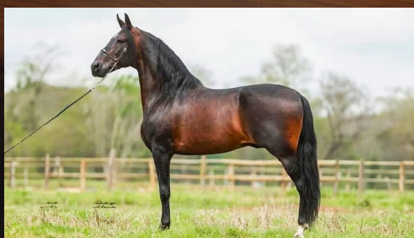
RADIANTE FORUM - PAI

SINCERO DO PORTO AZUL RIBALTA DE NANUQUE