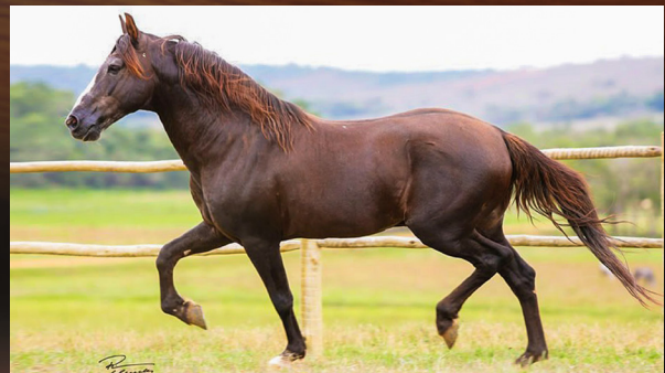
TRILHO DA ZIZICA - AVÔ