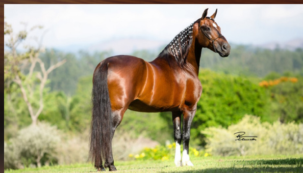
LÓTUS DA CATIMBA - AVÔ