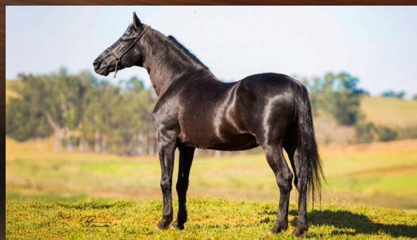
HAITY CAXAMBUENSE - AVÔ